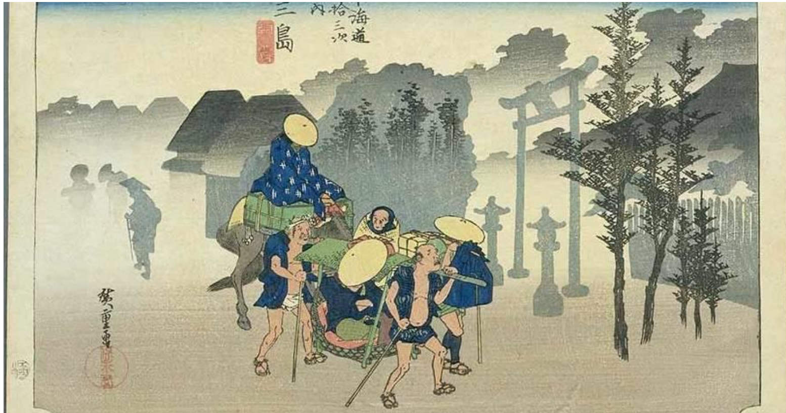
Scène de vie quotidienne