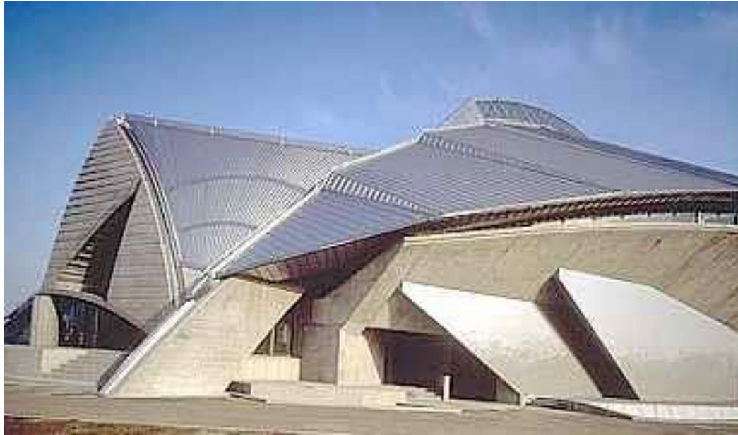
Architecture contemporaine de Fumihiko Maki