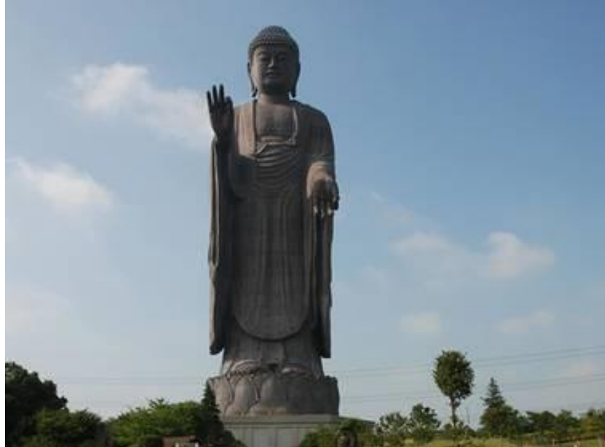
Ushiku Daibutsu, plus grand Bouddha du Japon