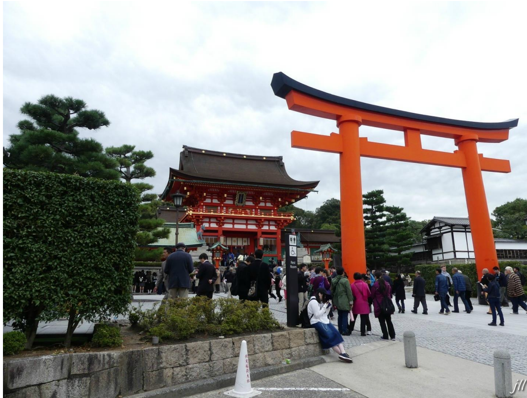
Torii et Temple construit en 711