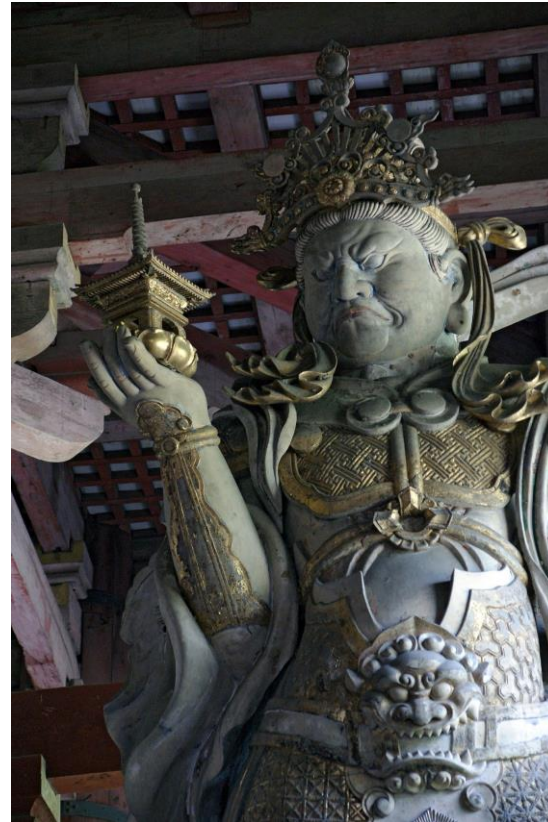
Divinité gardienne du Temple