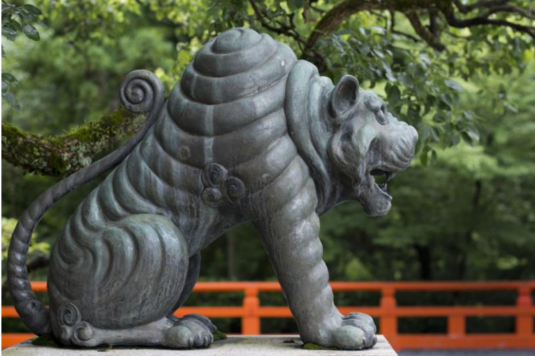
Figure protectrice des foyers