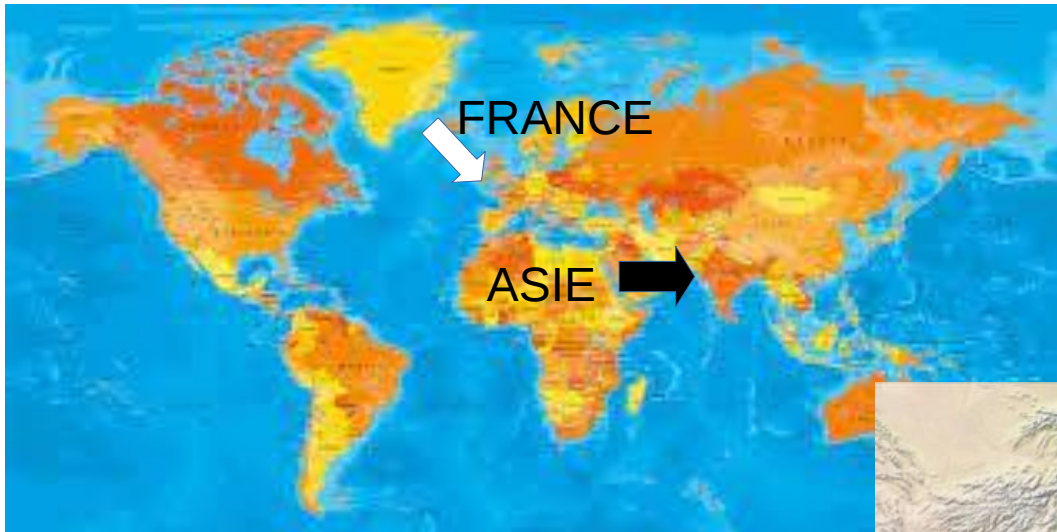
Carte de l'Asie