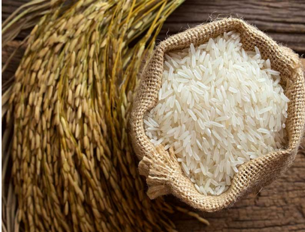
Le riz normal

Ce riz n'a rien de particulier C'est le même que l'on mange tous les jours