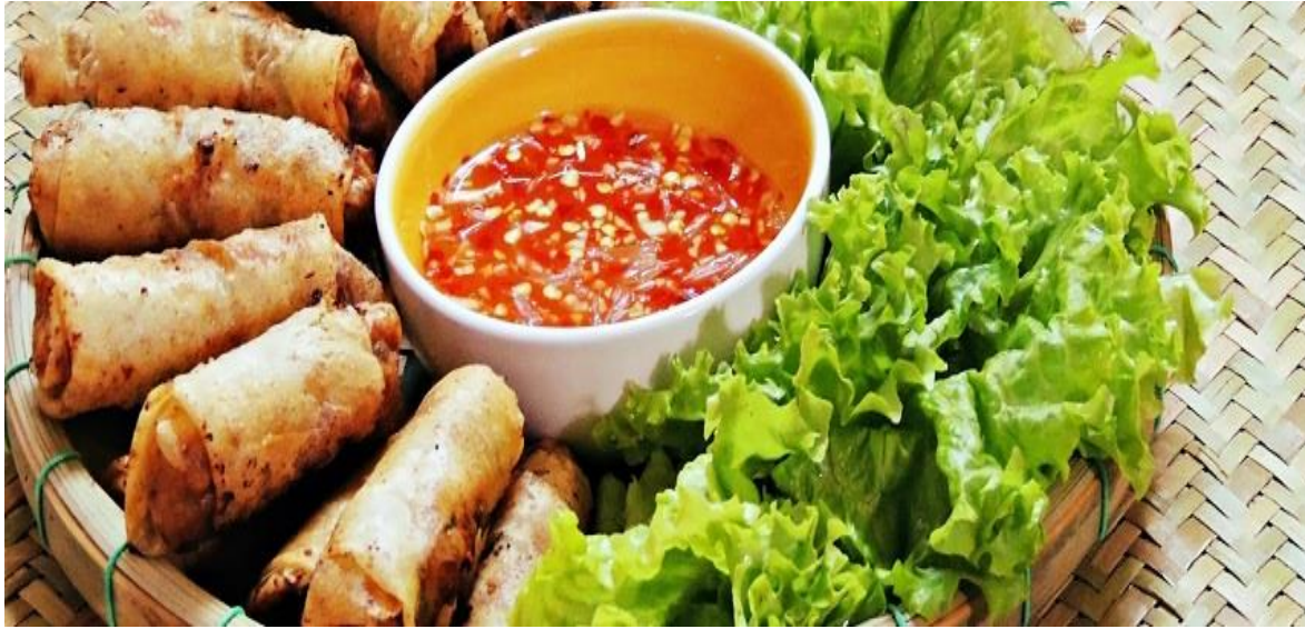
Plats typiquement vietnamiens