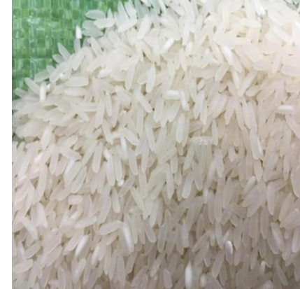
Le riz parfumé

Ce riz a un goût parfumé et non une odeur parfumée