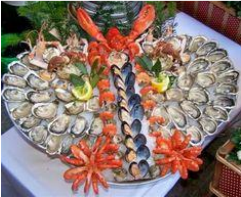
Plat de crustacés